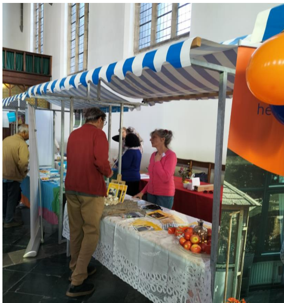
Stand Buddyzorg Limburg

In totaal hebben 160 vrijwilligers zich aangemeld waar we gesprekken mee hebben gevoerd. Hiervan zijn 130 personen doorverwezen naar een andere organisatie omdat die organisatie beter aansloot bij het aanbod. Wij vinden het belangrijk om het vrijwilligers aanbod niet verloren te laten gaan. Enkelen hebben we kunnen voorzien van informatie en advies en zij hebben daardoor voor een andere weg gekozen. Met 28 personen zijn we het traject van scholing en een inzet bij Buddyzorg aangegaan. In totaal zijn 76 vrijwilligers in 2023 actief geweest waarvan